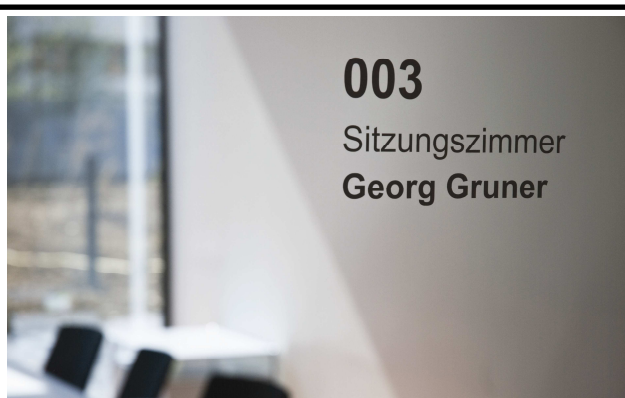
Bürobeschriftung, Foliebeschriftung auf Glas