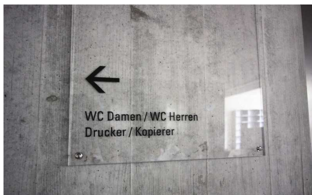
Orientierungsschild, Folie auf Plexiglas, direkt auf Sichtbeton befestigt