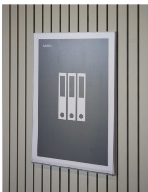
Raumbeschriftung zum Archiv