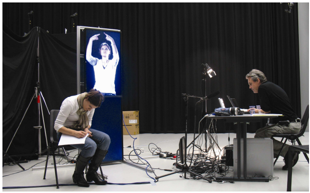
Aufnahmen für die Visionsstelen