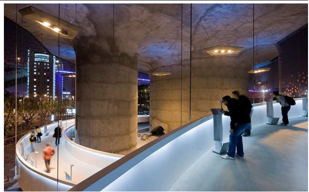
Ferngläser auf den Rampen