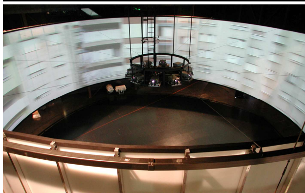
Projektoren im Einsatz