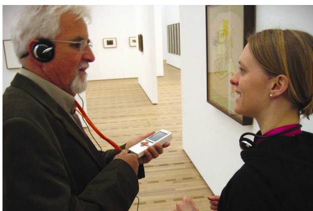
Schulung des Personals