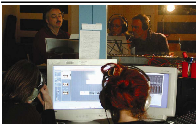
Audio-Aufnahmen im iart-Studio