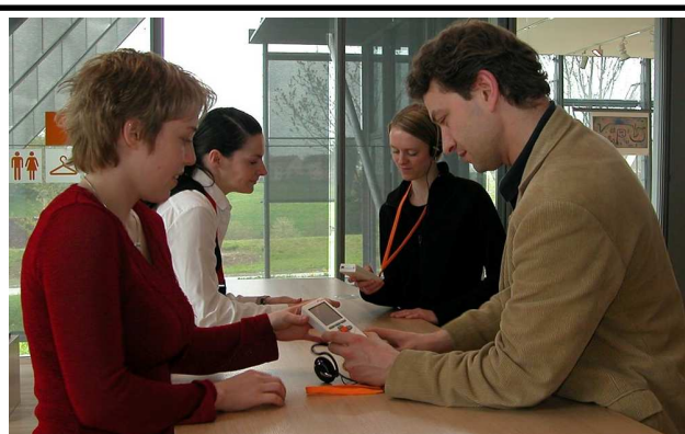
Ausgabe von Audioguides