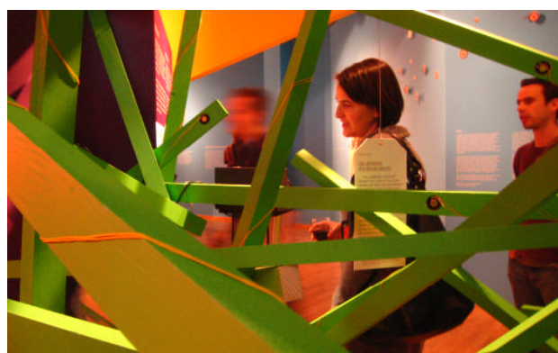
Besucherin vor der Pepper's-Ghost-Installation, gesehen durch den 'Flüsterwald'