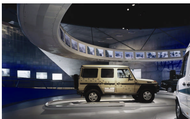
Der grosse Medienring in der Ausstellung