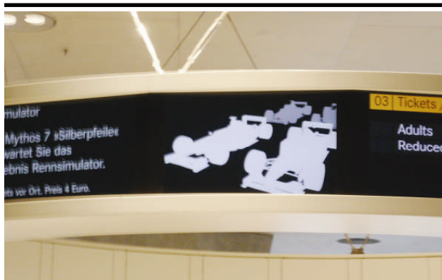
Ankündigung der Rennsimulatoren auf dem kleinen Medienring