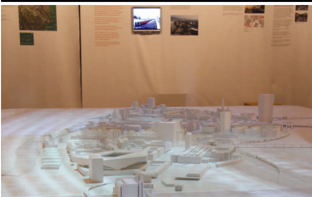
Modell des Stadtteils Zürich West