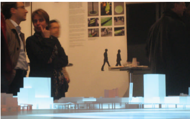
Das Stadtmodell am Eröffnungsabend des Infocenters