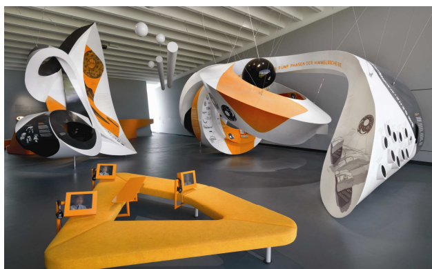
Medienstation der Ausstellung