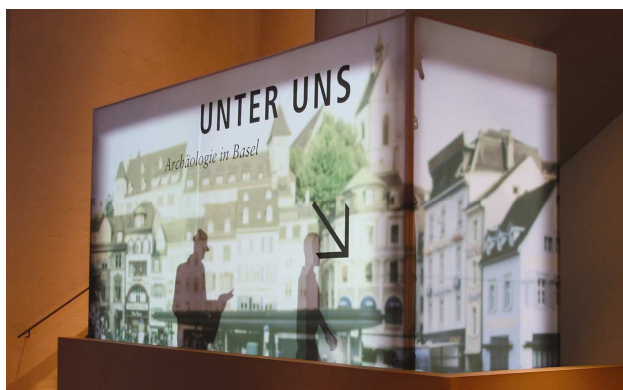
Pylon mit Film und bewegten Schattenfiguren