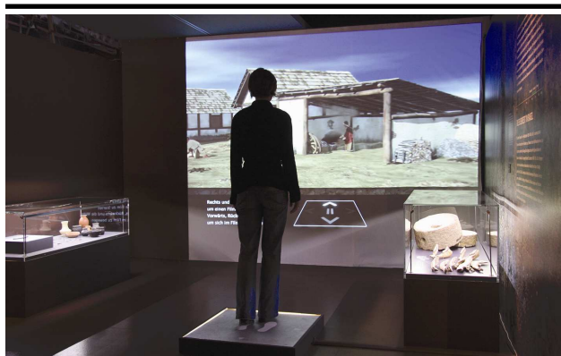
Virtueller Rundgang durch rekonstruierte historische Siedlung