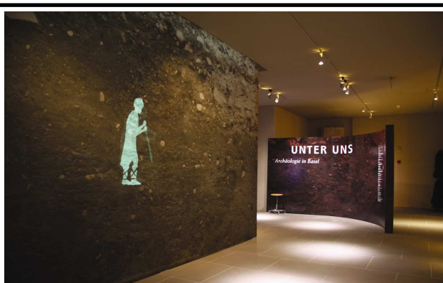
Animierte Figuren auf den Wänden