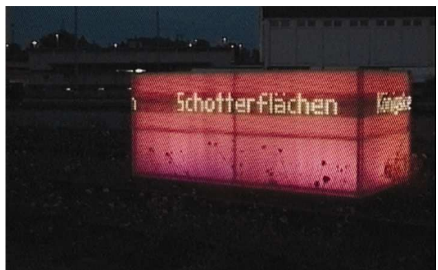
LIKLAK nachts auf dem NT-Areal in Basel