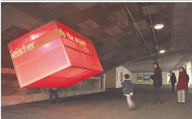
LIKLAK in der Birsig-Unterführung an der Heuwaage in Basel