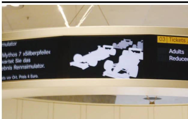
Ankündigung der Rennsimulatoren auf dem kleinen Medienring