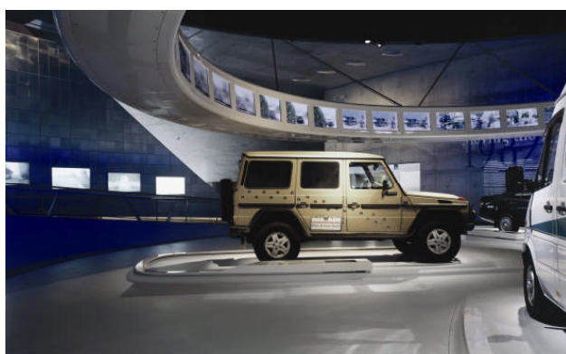
Der grosse Medienring in der Ausstellung