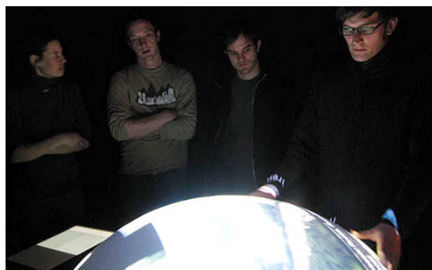
Naturgefahren, Video zum Thema Hochwasser