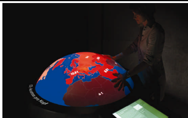
CO 2 -Ausstoss pro Kopf