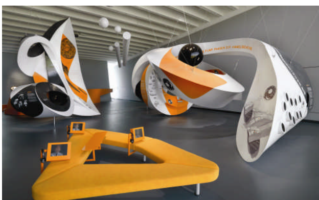
Medienstation der Ausstellung