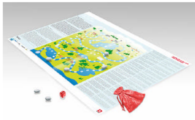
Brettspiel zur Ausstellung

Kunde/Auftraggeber Präsenz Schweiz, Bern