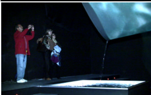
Besucher mit Blick ins Segel