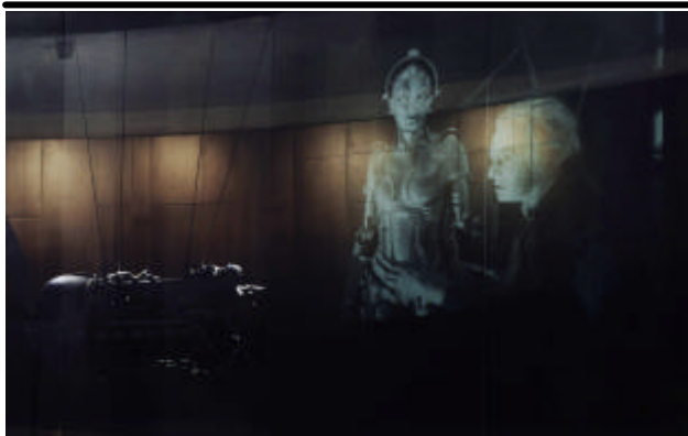
Projektion auf Kettenvorhang