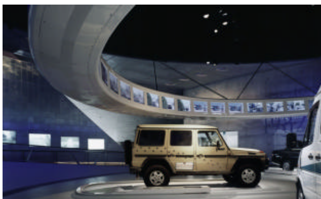
Der grosse Medienring in der Ausstellung