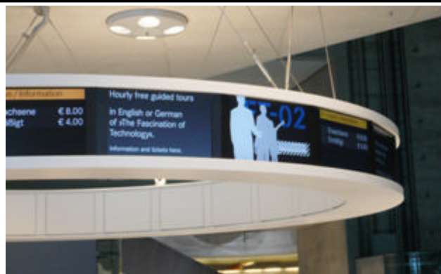
Tagesaktuelle Informationen in mehreren Sprachen