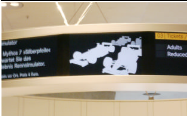
Detail kleiner Medienring