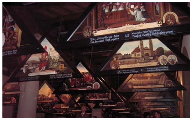
Die ausgestellten Bilder