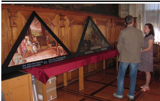
Die Kopien auf der Pressekonferenz