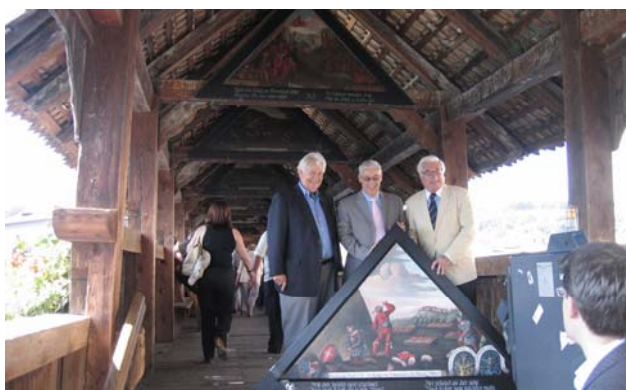
Posierend auf der Brücke