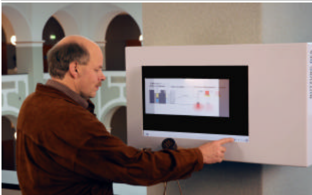
Interaktive Medienstation zur Präsentation von Forschungsergebnissen