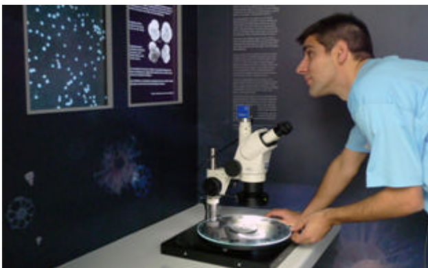
Binokular mit Informationen zum Präparat auf zwei Bildschirmen