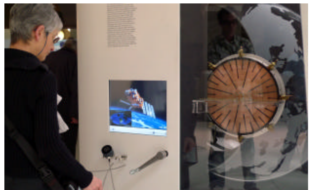
Medienstation zu Geomagnetismus