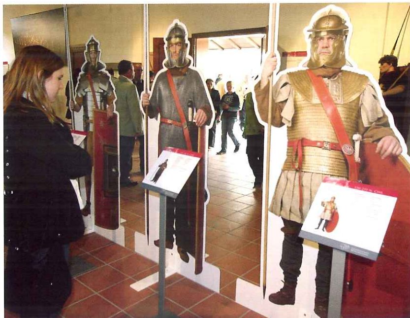
Abb. 1: Schlachtreihe

lagen auch modischen Trends. Als Vorlagen für die Rekonstruktionen sind Originalfunde und Nachbildungen in Vitrinen zu sehen. Sie stammen von der o. g. Interessengemeinschaft (VEX LEG VIII AVG), dem Römerkastell Saalburg, dem Hes-