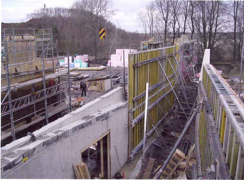
Abb. 1: Das Besucher-Informationszentrum der UNESCO-Weltnaturerbebestätte Grube Messel – der Baufortschritt am 24. März 2009

Gut Ding will Weile haben. Es hat etwas gedauert, bis nach Planung, Finanzierung und vor allem baulicher Realisierung Deutschlands bisher einzige UNESCO-Weltnaturerbe-Stätte, die Grube Messel bei Darmstadt, ein dem hohen ideellen Wert entsprechend modernes Informationszentrum am Rand der Grube erhalten wird.